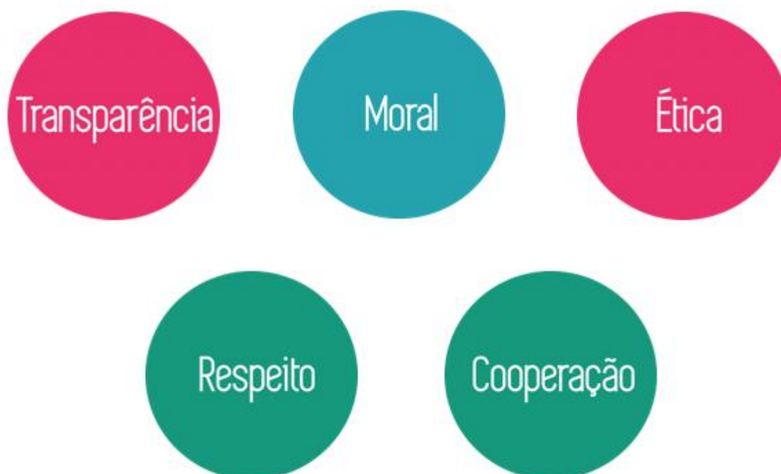
Figura 1 - Valores da World Needs